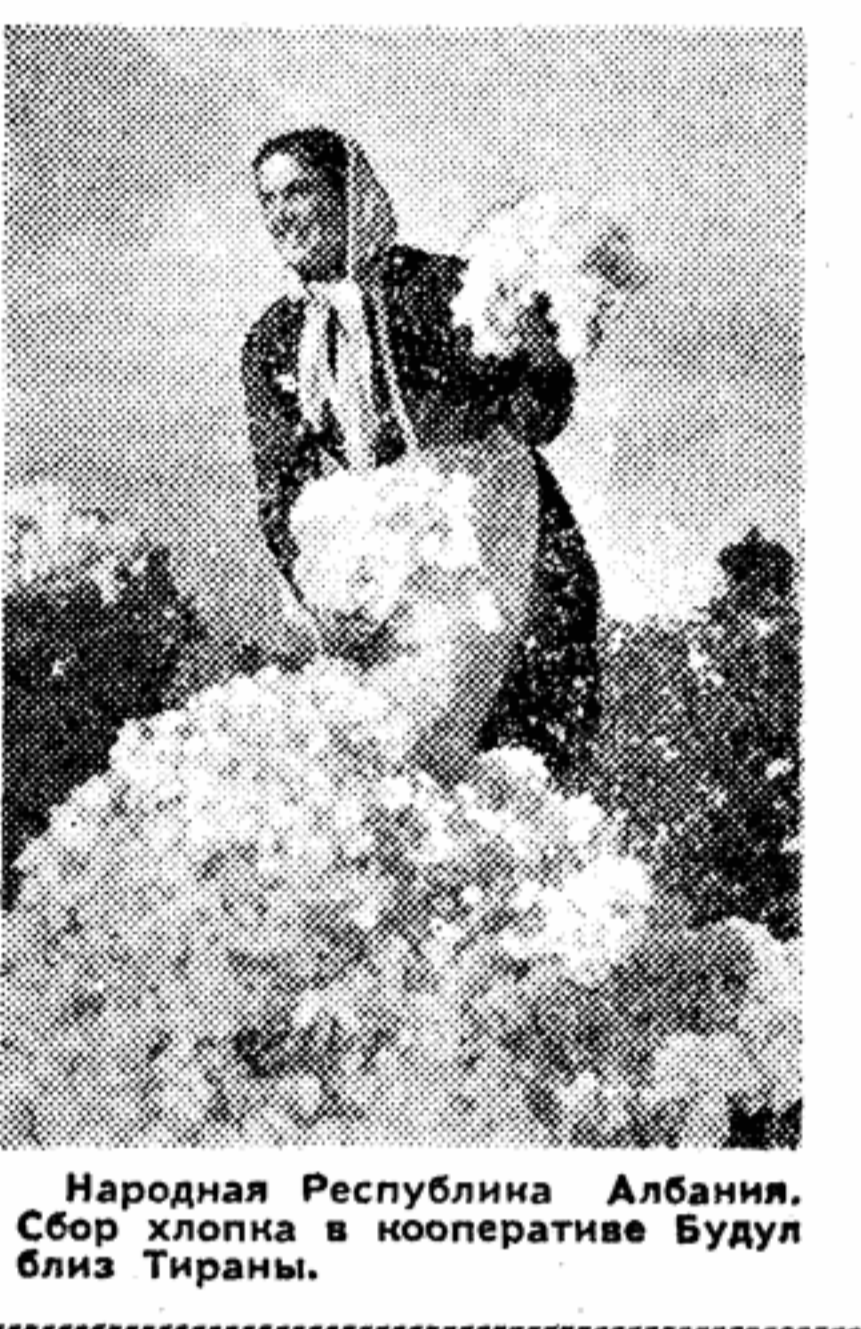
Народная Республика Албания. Сбор хлопка в кооперативе Будул близ Тираны.

Венами под турецким гнетом отставив албанский народ свою национальную культуру. Однако уделом его были невежество и нищета. В начале прошлого века, отправив Чалды-Гарольда в путешествие по Албании, Байрон заставил своего героя распространиться с просвещением. И уж совсем недавно, не далее как в 1938 году, 80 процентов населения страны оставалось неграмотным. В Албании не было ни одного института и имелось всего 3 гимназии. И все же депутаты помещичьего парламента Зогу вопили о перепроизводстве интеллигенции, о том, что выпускникам гимназии в скором времени придется поступать в учебники к бакалейщикам.