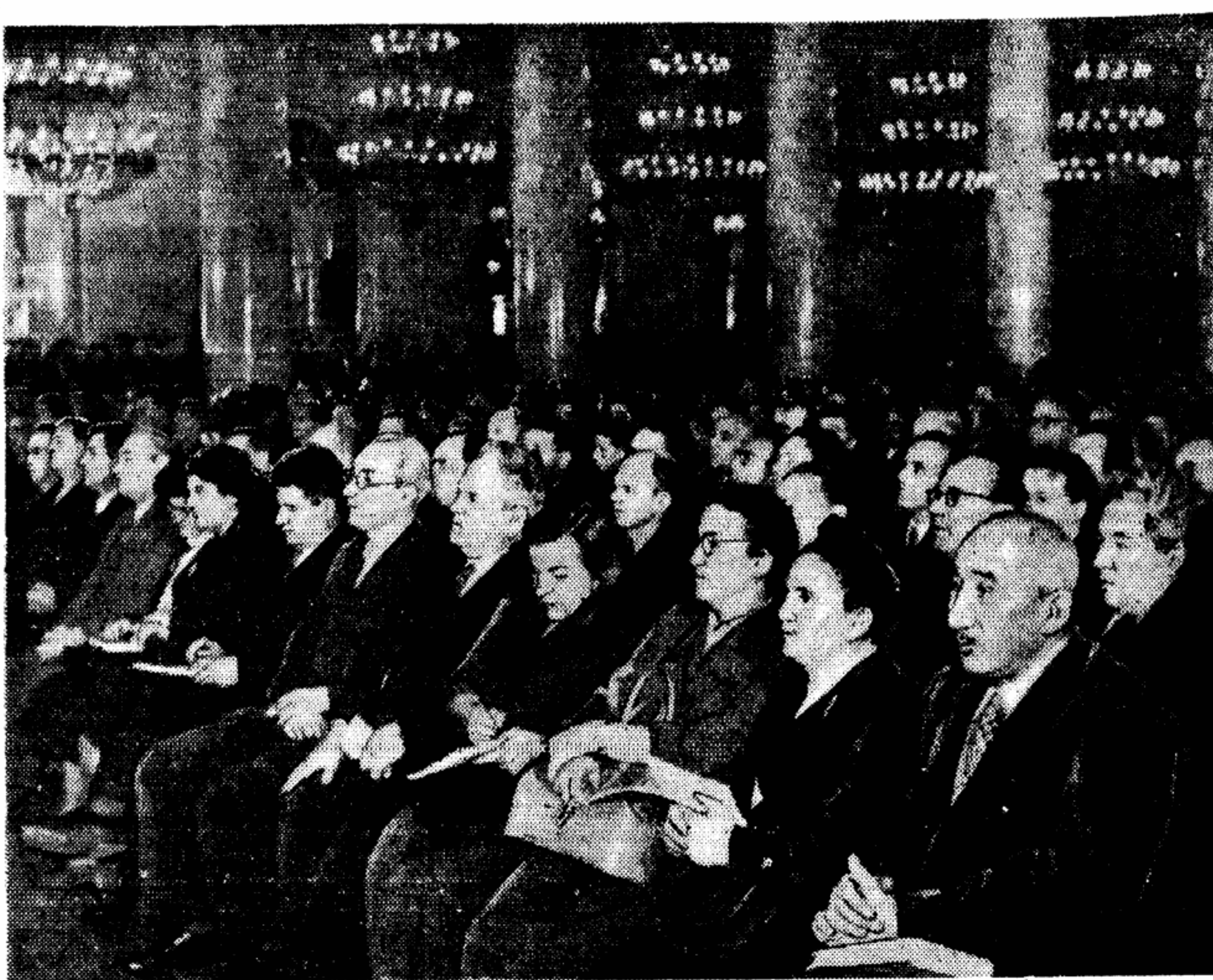
В Колонном зале Дома союзов во время собрания.

От писателей народы вправе ожидать новых горячих слов, новых книг, сражающихся за мир во всем мире.